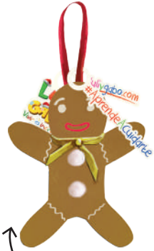
¡Imagen de guía!