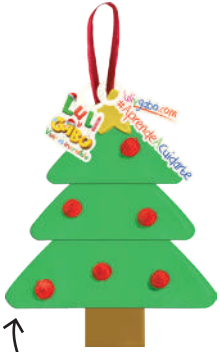
¡Imagen de guía!

¡A decorar! Cuelga en tu arbolito. Si es un lugar alto es mejor que pidas ayuda a un adulto para evitar caerte.